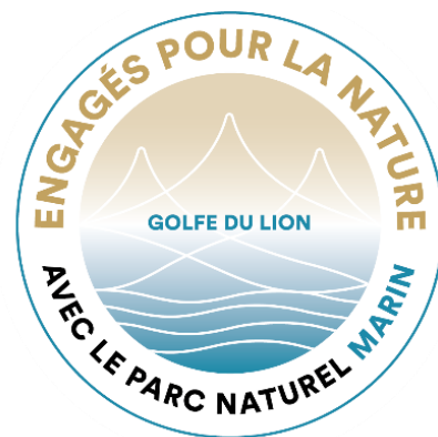
Visuel "engagé avec le Parc naturel marin du golfe du Lion"

Elle fournit un socle commun d'engagements à tous les professionnels exerçant dans le Parc pour de bonnes pratiques en matière d'activités de découverte du milieu marin.